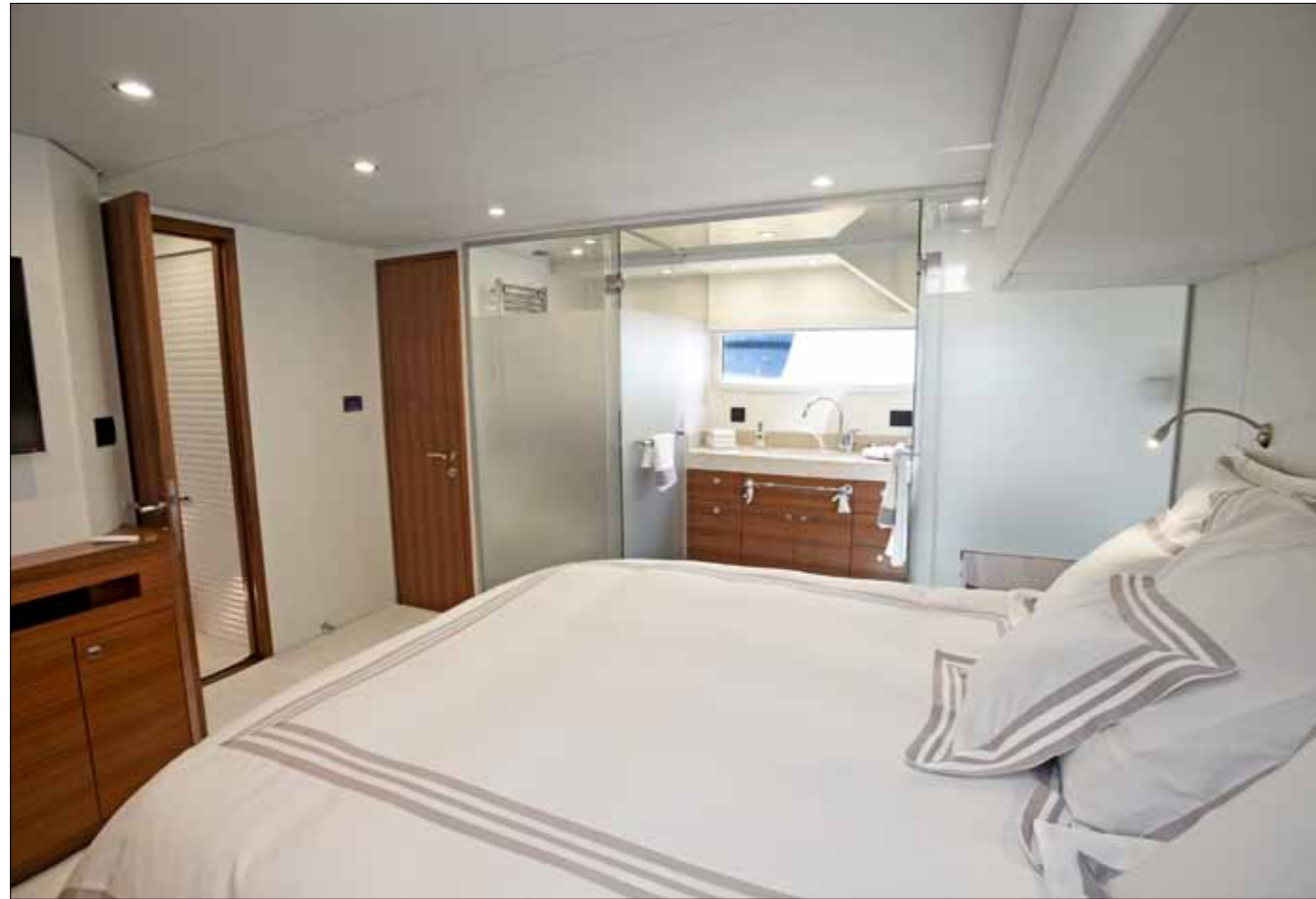
Située au centre, tradition oblige, la suite de l'armateur dispose de deux mètres de hauteur sous barrots.