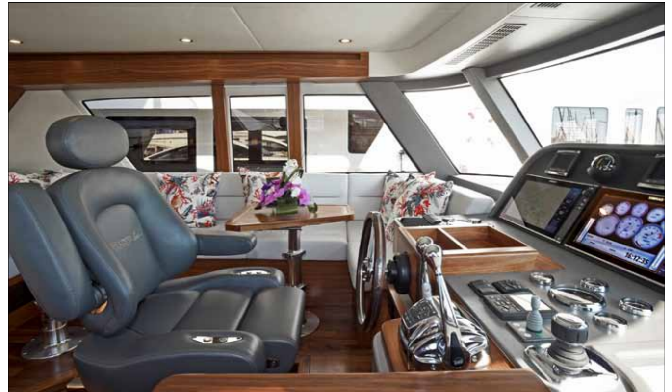
Confortablement installé sur son fauteuil en cuir, le pilote dispose d'un superbe tableau de bord et d'une parfaite vision vers l'avant.