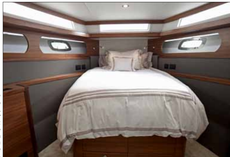
La cabine VIP placée en pointe est spacieuse. La hauteur étonnamment surélevée de son lit en île pourra en séduire plus d'un.

► 9,5 nœuds. Elle culmine à 212 l/h à 20 nœuds de pointe. Confortable en navigation, le 620 Trident offre à son bord des aménagements très soignés. On est ici dans un registre cosy et fonctionnel, d'inspiration certes classique mais pas «old fashion». Les axes de circulation sont fluides et les passagers apprécient la surface des aires de vie. Parfaitement protégés par des hauts pavois, les larges passavants facilitent les accès latéraux entre le salon du pont avant et celui aménagé dans le cockpit.